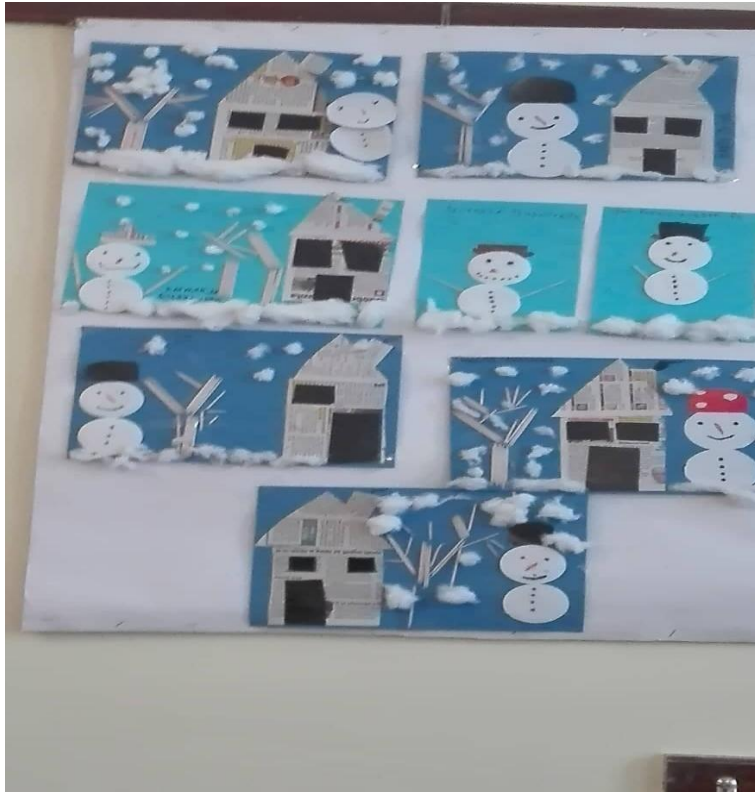
„Новогодишња јелка" 14.12.2018.