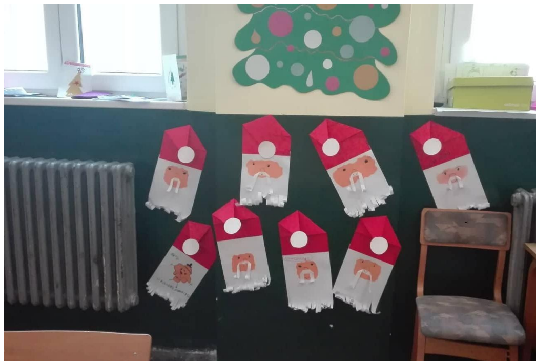
„Свети Сава- школска слава" 21.01.2019.-25.01.2019.