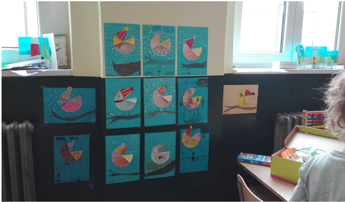
„Зимске радости" 30.11.2018.