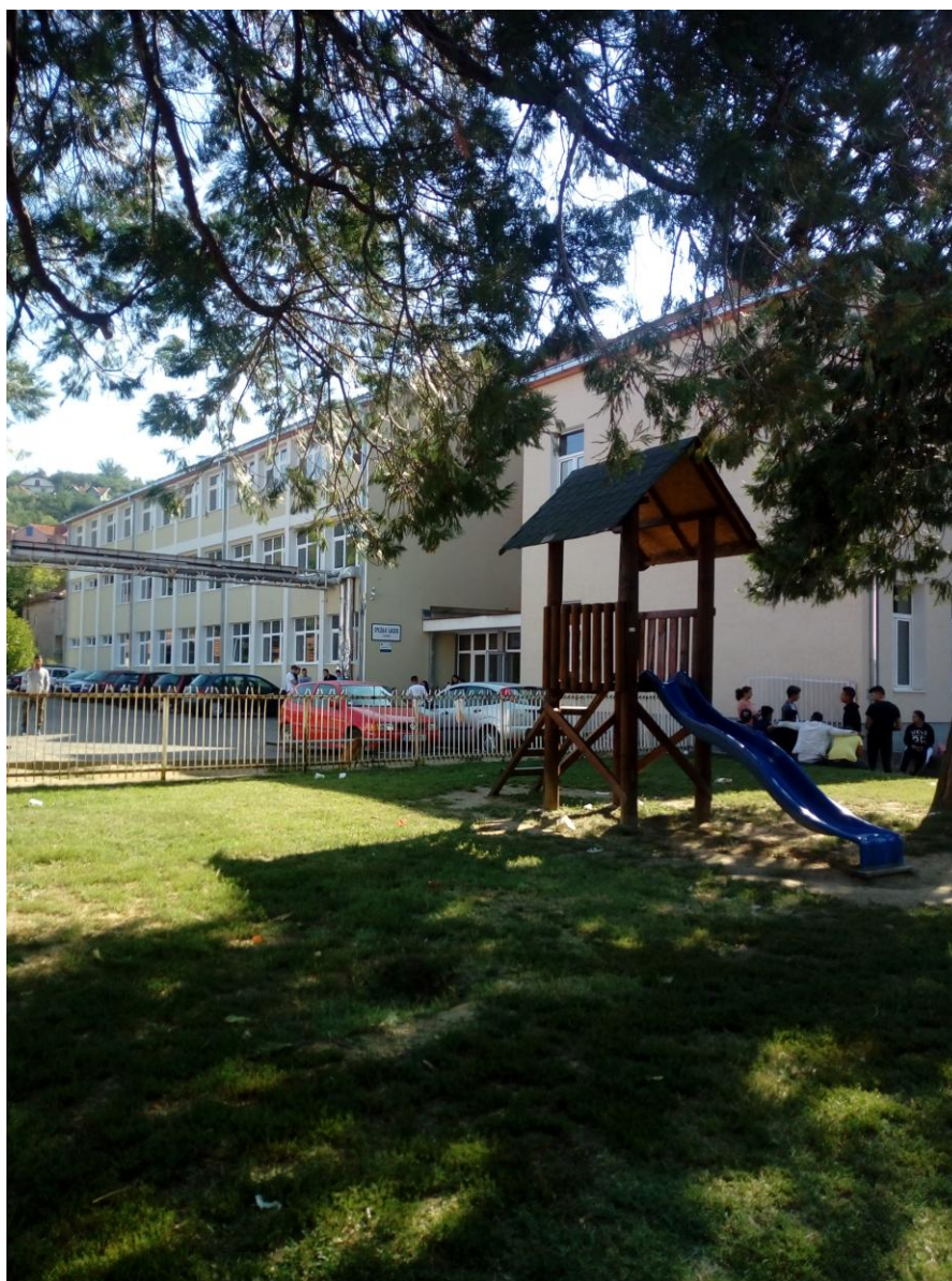
Школа, септембар 2018. год.

Овим школским развојним планом наша школа тежи да оствари своју мисију, унапреди и иновира свој рад бројним активностима у доброј вери да ће нас све то приближити нашој визији.